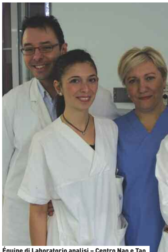
Équipe di Laboratorio analisi – Centro Nao e Tao

Essendo farmaci prescritti con Piano Terapeutico hanno come target principalmente i pazienti con livelli di scoagulazione inadeguata con i farmaci