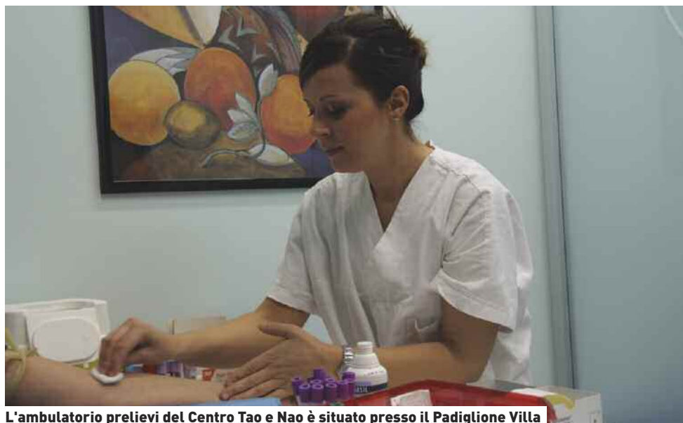
L'ambulatorio prelievi del Centro Tao e Nao è situato presso il Padiglione Villa